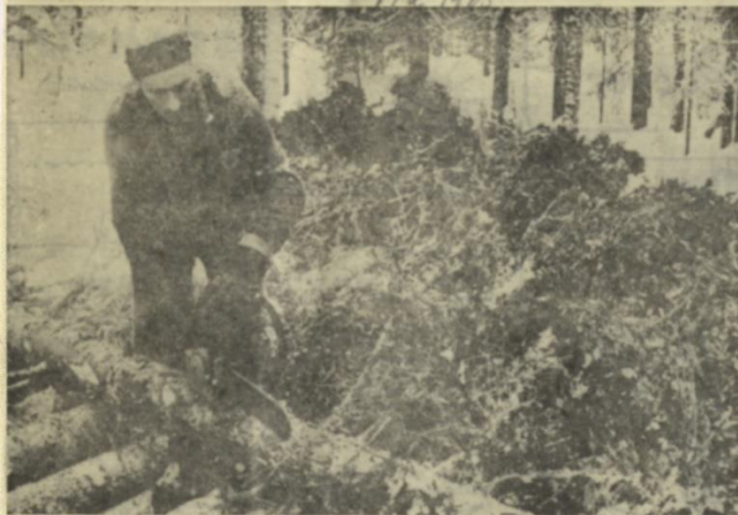
Yxan har blivit omodern i skogen. Här kvistar Thore Lundgren till synes lekande lätt med motorsåg.