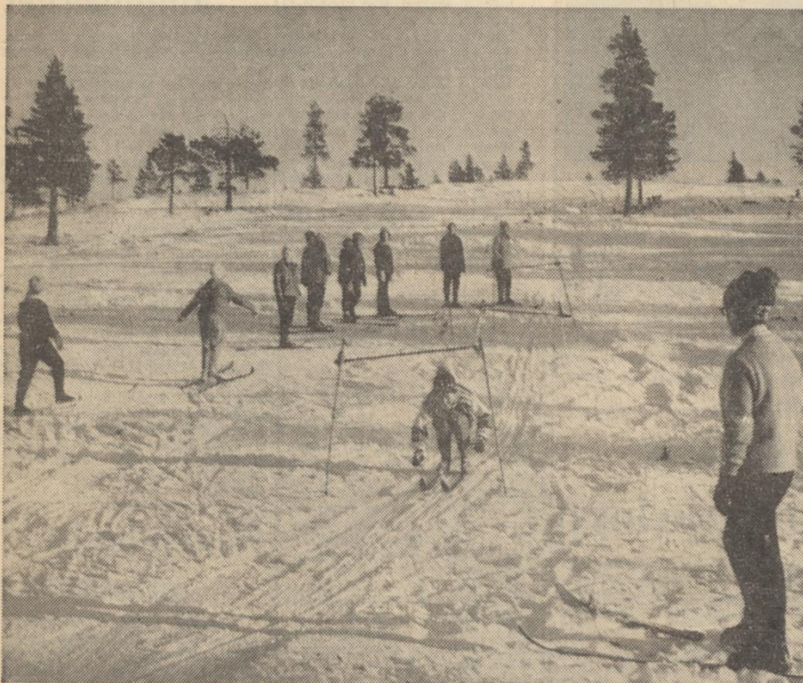
Inga våldsamma löpor utan lagomt "stjört vänliga" är som synes utförlöparna på Ålidberget.

INTRESSET FÖR SKIDÅKNING som motion har glädjande nog visat ökning i nordmalingsbygden. Tyvärr, kanske man måste säga, är dock det yngre gardet mest intresserat av utförsåkning. Och de har under de se-